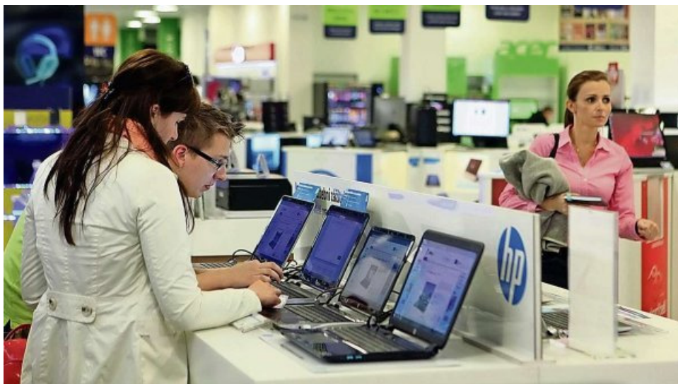
Showroom e-shopu firmy Alza.cz v Praze

Po dvaceti letech existence začal být pro největší český e-shop zdejší trh malý. Alza.cz proto expanduje do dalších 26 zemí, a od úterý tak začíná odesílat zboží do celé Evropské unie. Do zahraničí chce ze svého skladu dodávat celý svůj sortiment, pobočky v cizině ale zatím neplánuje.